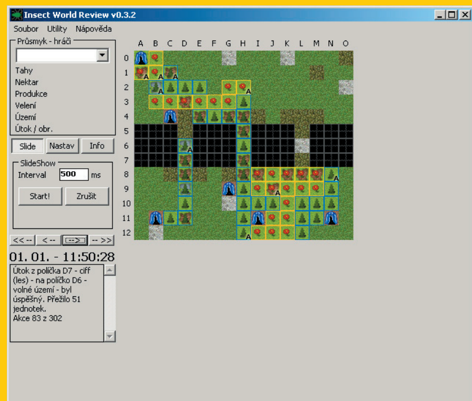
Screenshot ze hry a přehrávač záznamů